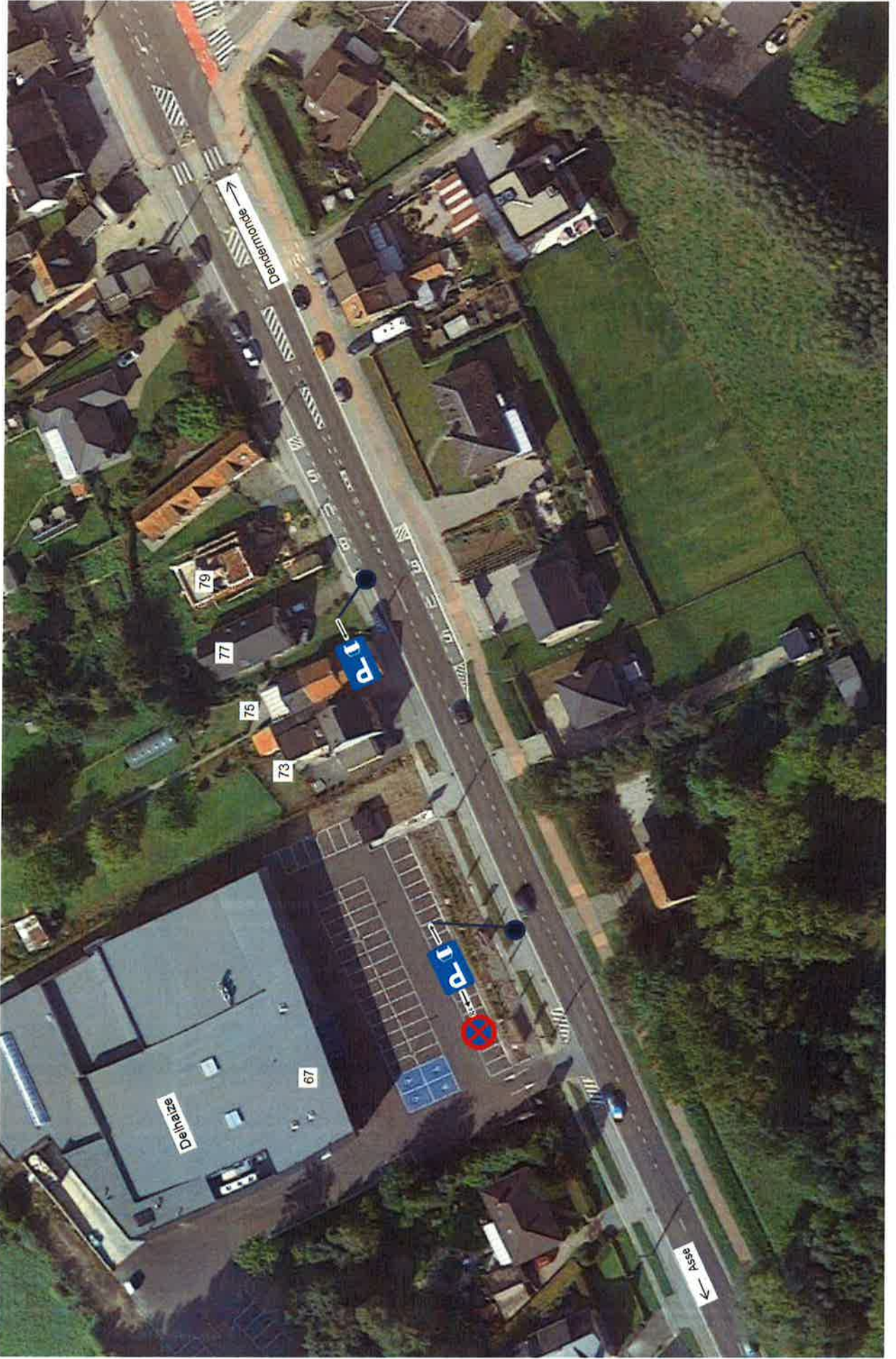
N47 - Stwg op Dendermonde thv huisnummers 67 tot 77 (Delhaize)