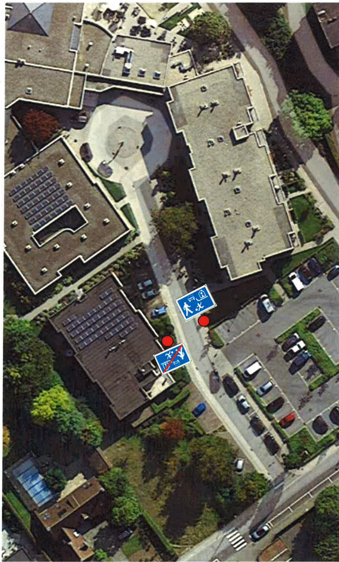
Zorgcampus, Kloosterstraat 75 – 1745 Opwijk