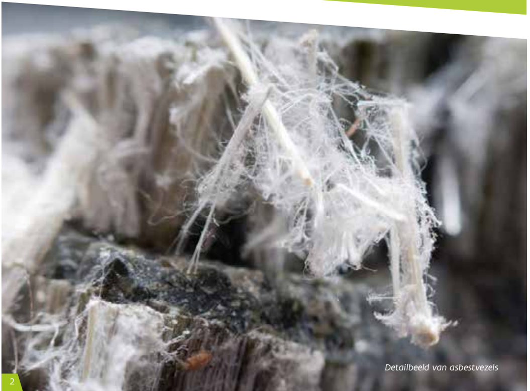
Detailbeeld van asbestvezels

De OVAM helpt u met deze brochure om samen het asbestbeest te verslaan.