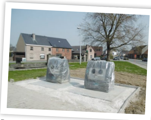
Twee nieuwe ondergrondse glascontainers in de Nanovestraat.

Ondertussen kan je met je glasafval terecht bij de andere bovengrondse glasbollen en de twee ondergrondse afvalstraten aan De Boot/sporthal (Heiveld) en parking Dorp te Mazenzele.