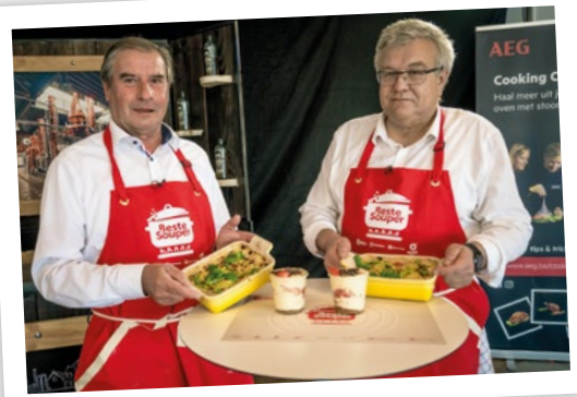
Deelnemend duo voor Koninklijke Harmonie De Volherding.