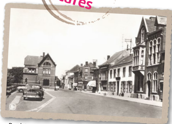
De plets, midden 20 e Eeuw.