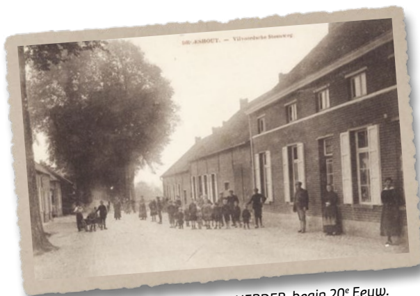
Café DE HERDER, begin 20 e Eeuw.