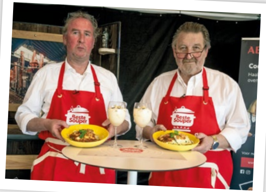
Deelnemend duo voor Eendracht Mazenzele Opwijk.

Koninklijke Harmonie De Volherding en Eendracht Mazenzele Opwijk nemen het op tegen elkaar en vijf andere gemeenten. Benieuwd wie de beste kookkunsten heeft en naar de finale gaat? Volg dan mee op RINGtv. Zij zenden de kookwedstrijd uit van 8 mei tot 19 juni 2021 . Daarnaast zullen ook heel wat andere Opwijkse verenigingen in de kijker worden gezet met een tv-spot. Reden te meer dus om te kijken en Opwijk te zien bruisen!