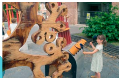
ANIMATIE PARK HOF TEN HEMELRIJK Eiland Amadeo