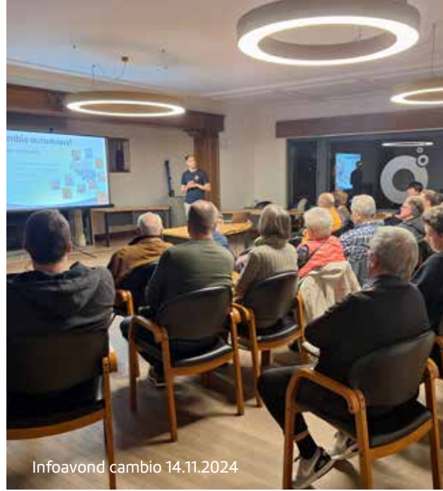
Infoavond cambio 14.11.2024

Als je minder dan 11.000 km per jaar rijdt, is het vaak voordeliger om je auto te vervangen door een deelwagen. Je betaalt alleen voor de kilometers die je werkelijk maakt, en hebt toegang tot goed onderhouden voertuigen zonder de kosten en zorgen die bij een eigen wagen komen kijken. Bovendien kun je je abonnement delen met familie of burens, waardoor het nog goedkoper wordt. Ga je op vakantie? Je kan je abonnement tijdelijk aanpassen en zelfs naar het buitenland rijden met de deelwagen.