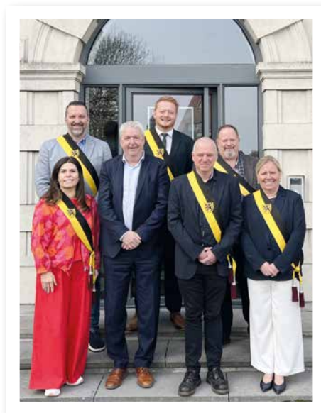
Bezoek van gouverneur Jan Spooren op 6 maart 2026.