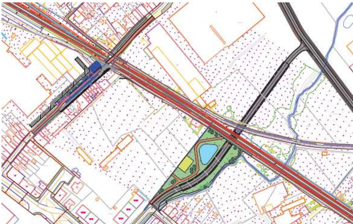
Voorstel fietstunnel Fabriekstraat - autotunnel verlengde Beekveldstraat